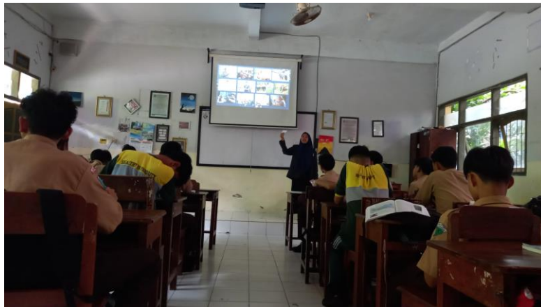
Gambar 2. Penggunaan media flashcard dalam menjelaskan mufrodat Bahasa Arab

dilanjutkan dengan memperkenalkan huruf atau kosa kata berikutnya dengan cara yang sama.