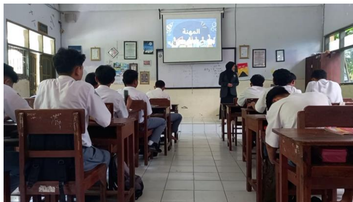
Gambar 1. Pembelajaran bahasa Arab materi profesi tanpa media flashcard

tambahan. Proses ini berlangsung secara konvensional, di mana peneliti menjelaskan arti mufrodat kemudian memberikan kesempatan kepada siswa untuk mengulanginya. Setelah kegiatan menghafal selesai, peneliti memberikan lembar pretest kepada seluruh siswa untuk mengukur kemampuan awal mereka dalam menguasai kosakata profesi. Hasil pretest ini menjadi dasar untuk mengetahui sejauh mana penguasaan mufrodat siswa sebelum diberi perlakuan melalui penggunaan media flashcard pada pertemuan berikutnya.